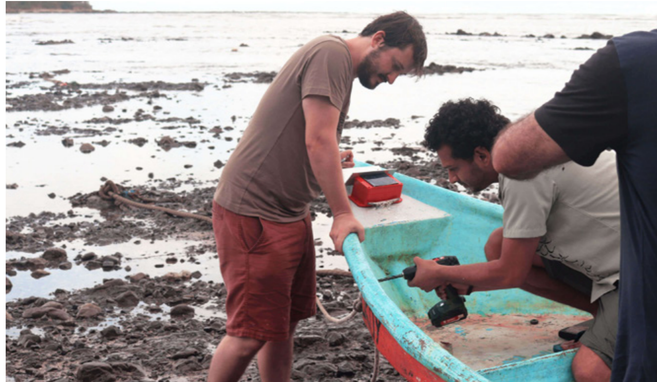
Abbildung 7: Installation eines Schiffsüberwachungssystems.

Etwa 20 bis 30 % des weltweiten Fischfangs stammen Schätzungen zufolge aus illegaler, undokumentierter und unregulierter Fischerei (IUU) und erhöhen damit den Druck auf die ohnehin stark beanspruchten marinen Ressourcen. Der jährliche Schaden der IUU-Fischerei wird auf 23 Mrd. US-Dollar beziffert. Eng verbunden mit illegaler Fischereipraxis ist der hohe Anteil von Beschäftigten in Zwangsarbeit. Eine Kombination aus Datenlösungen, moderner Technologie und internationalen Kooperationen könnte zur Lösung der Probleme beitragen.