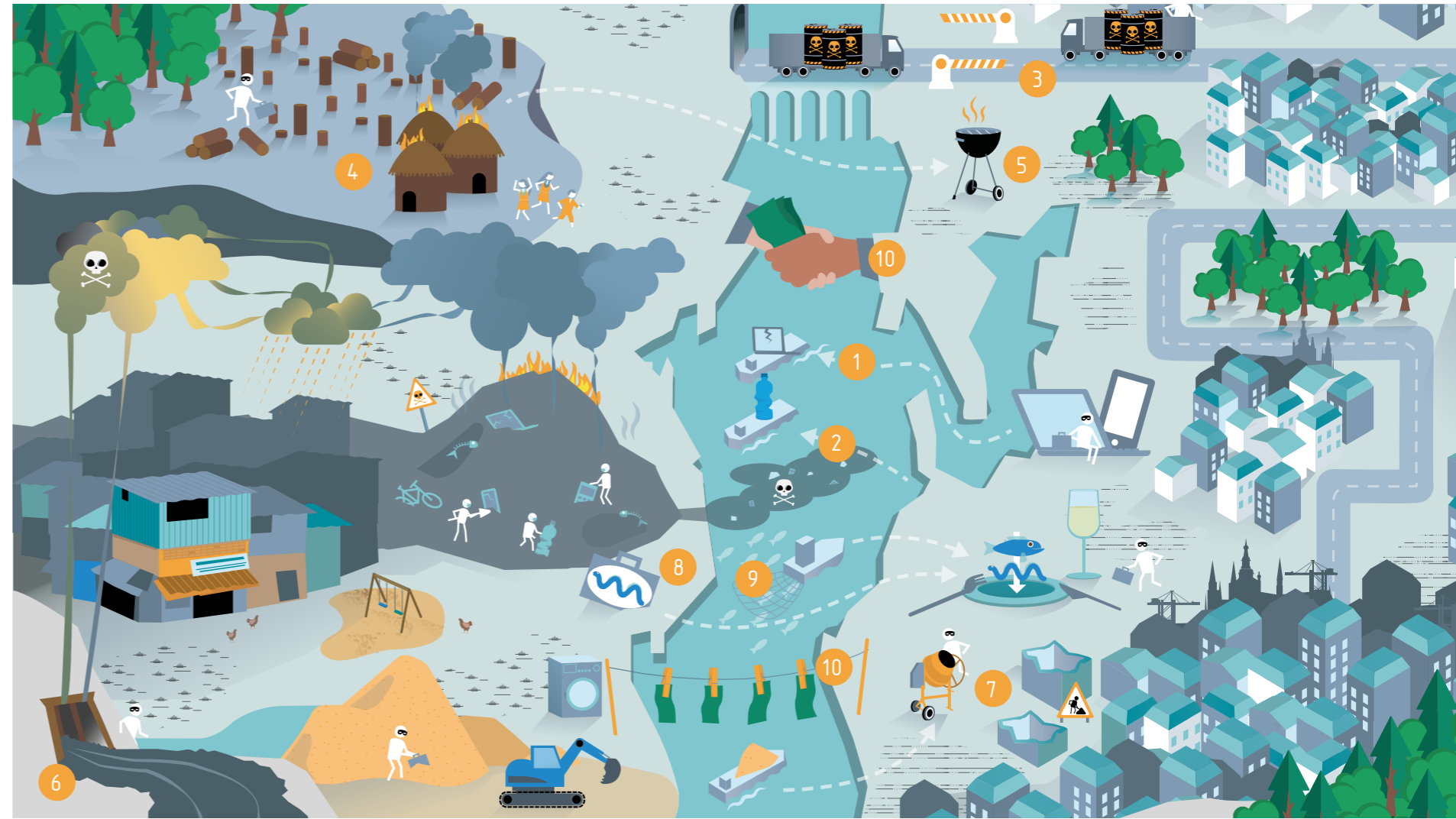
Abbildung 1: Erscheinungsformen von organisierter Umweltkriminalität

Aus der Perspektive krimineller Netzwerke ist organisierte Umweltkriminalität ein perfektes Geschäftsfeld: Die Gewinnmargen für Holz, Wildtiere, Abfall, Fischereiprodukte oder Rohstoffe aus illegaler Herkunft sind hoch, die Aufklärungsraten und das Strafmaß vergleichsweise gering. Armut und Perspektivlosigkeit in den Herkunftsländern führen dazu, dass Akteure am unteren Ende einer kriminellen „Wertschöpfungskette“ schnell ersetzt werden können. Zudem ist die organisierte Umweltkriminalität eng verwoben mit Korruption und Geldwäsche. So verwundert es kaum, dass laut einer 2020 veröffentlichten Studie Umweltkriminalität an dritter Stelle der Rangliste organisierter Verbrechen positioniert ist – gleich hinter Produktfälschungen und Drogenhandel (INTERPOL et al., 2020). Die ökonomischen, ökologischen und gesellschaftlichen Auswirkungen sind erheblich: