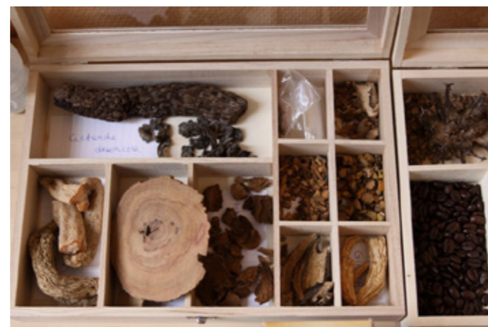
Abbildung 8: Deutsche Vorliebe für Grill-Holzkoale bzw. traditionelle chinesische Medizin – kulturelle Identität macht es schwer, umweltschädliche Aktivitäten zu verändern.