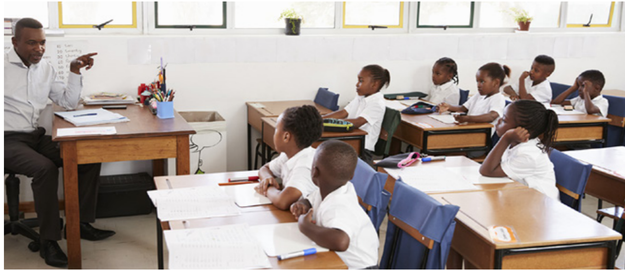
Abbildung 9: Unterricht in einer afrikanischen Schule.