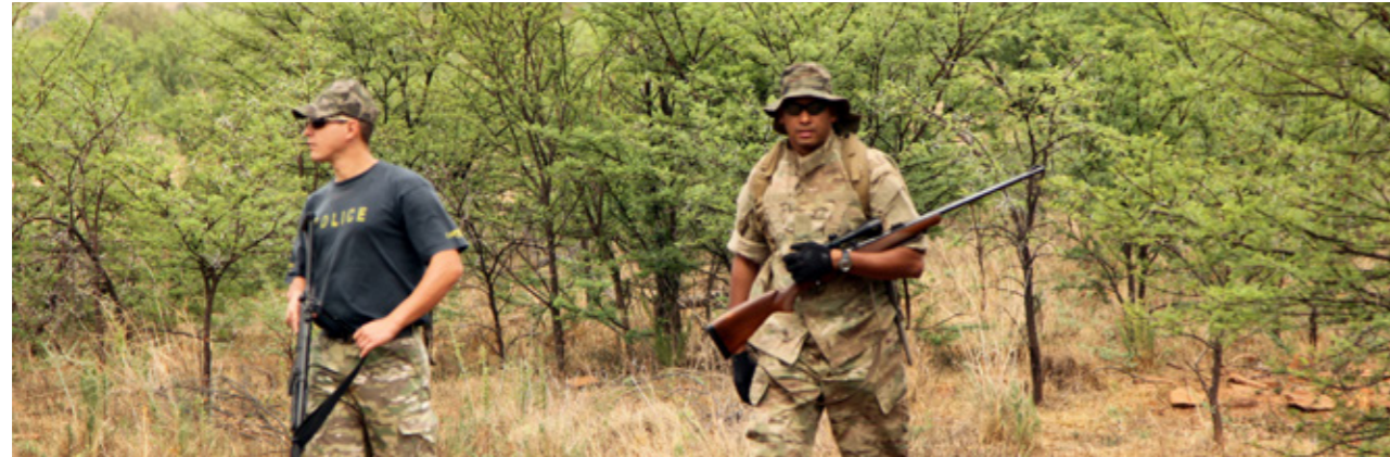
Abbildung 6: Bewaffnete Anti-Wilderer-Einheit zum Schutz vor Wilderern in Südafrika.

Laut des globalen Zustandsberichts zur Artenvielfalt des Weltbiodiversitätsrates (IPBES) nimmt die Zahl der Tier- und Pflanzenarten weltweit dramatisch ab. Der illegale Tierhandel ist gemeinsam mit der Übernutzung natürlicher Ressourcen und dem Klimawandel eine der größten Bedrohungen für Tier- und Pflanzenarten. Neueste Technologien, wie innovative Methoden zur DNA-Analyse, unterstützen den Kampf gegen den illegalen globalen Handel mit geschützten und bedrohten Lebewesen.