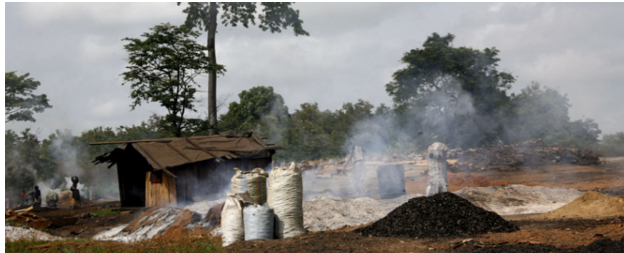
Abbildung 4: Die illegale Herstellung von Holzkohle zerstört die tropischen Regenwälder in Westafrika.

Der illegale Holzeinschlag macht bis zu 30 % der weltweiten Aktivitäten im Forstsektor aus. In den wichtigsten tropischen Erzeugerländern sind es sogar bis zu 90 %. Die Ursachen liegen oft in den prekären Lebensverhältnissen vor Ort und fehlenden oder nicht funktionierenden Institutionen. Die Spanne reicht von kleinräumiger Abholzung durch die Landbevölkerung bis hin zu kriminell organisiertem Holzhandel. Neueste Technologien unterstützen Umweltschutzorganisationen und Behörden bei der Überwachung und Verfolgung von Straftaten.