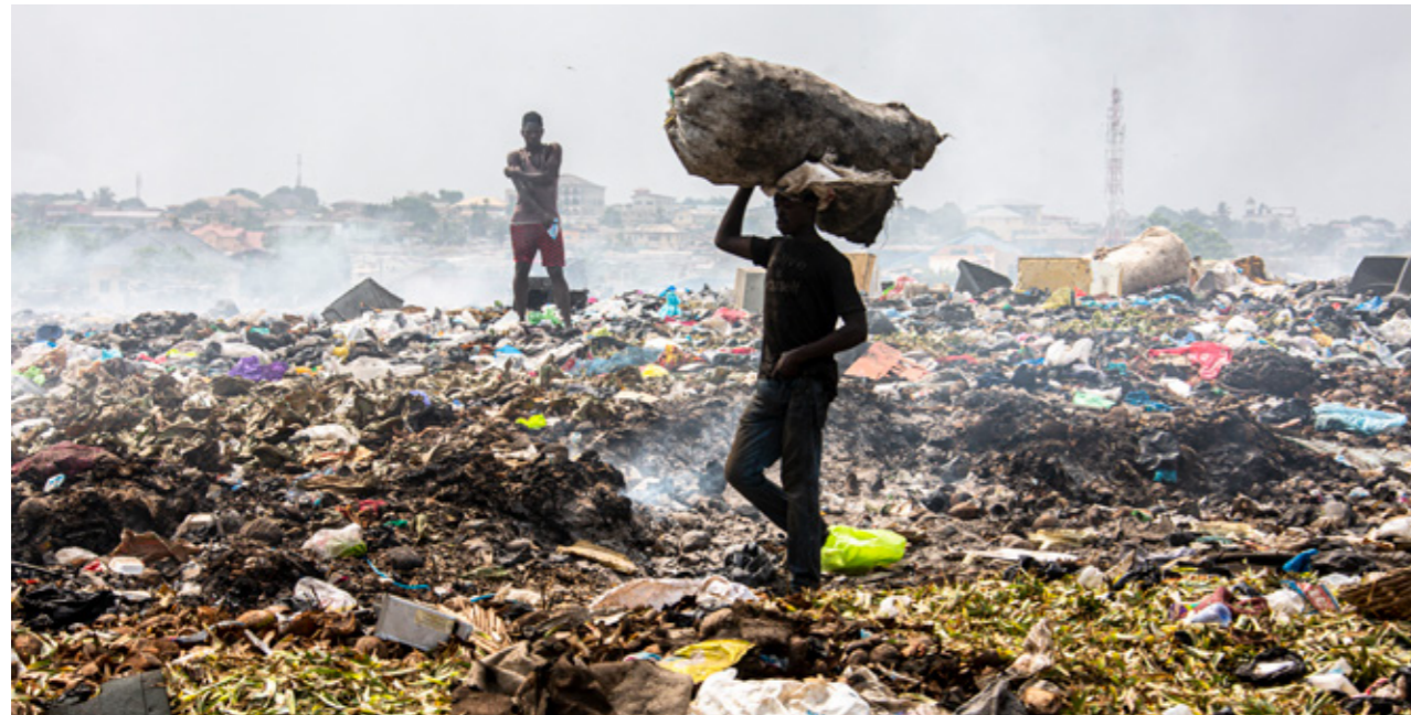
Abbildung 3: Abfalldeponie in der Millionenstadt Accra, Ghana.

Bevölkerungswachstum, höheres Einkommen und die Industrialisierung in vielen Entwicklungsländern sorgen für eine steigende Nutzung elektrischer und elektronischer Geräte. In den vergangenen Jahren wurden Millionen Tonnen Elektroschrott aus Europa illegal in Nicht-EU-Länder exportiert. Dies hat negative Folgen für die Umwelt und die Gesundheit in den Bestimmungsländern. Eine engere Koordination von Justiz und Behörden unter Einbeziehung technologischer Tools soll Lücken in der Strafverfolgung schließen.