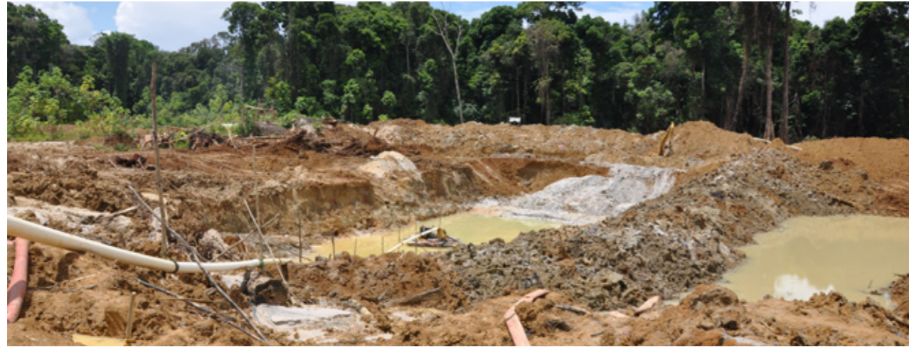
Abbildung 5: Umweltzerstörung durch eine illegale Goldmine im Regenwald.

Der weltweite Rohstoffverbrauch ist rasant gestiegen. Er wird sich laut Weltressourcenrat (International Resource Panel, IRP) bis 2060 mehr als verdoppeln. Illegaler Bergbau und der Handel mit Mineralien und Edelmetallen sind deshalb ein lukratives Geschäftsfeld für kriminelle Netzwerke. Um globale Rohstofflieferketten besser nachverfolgen zu können, sind innovative, digitale Technologien ebenso gefragt wie verbesserte Governance-Strukturen zur Einhaltung von Sozial- und Umweltstandards.